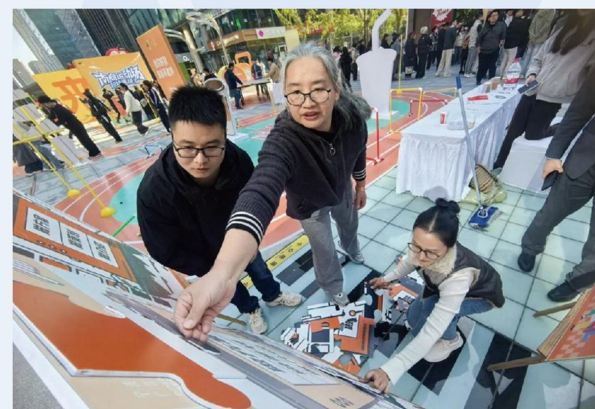
参加南部商务区楼宇运动会团体趣味赛活动