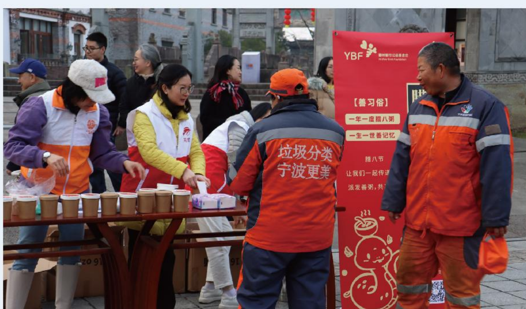
善园点位分发腊八粥