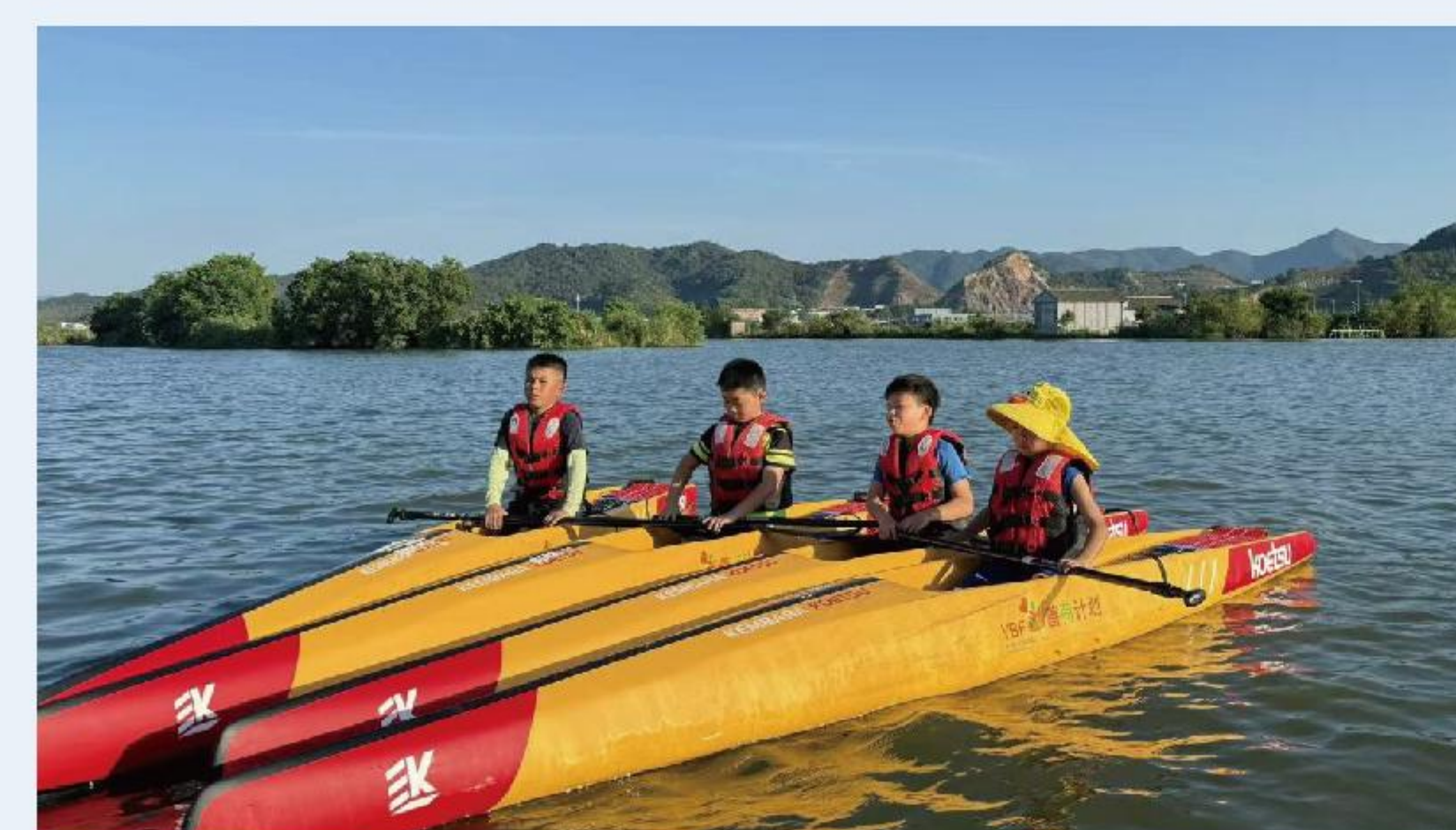
云龙赛艇培训中心慈善创业共富基地项目-2025年中国桨板俱乐部联赛（宁波慈溪站）参赛现场