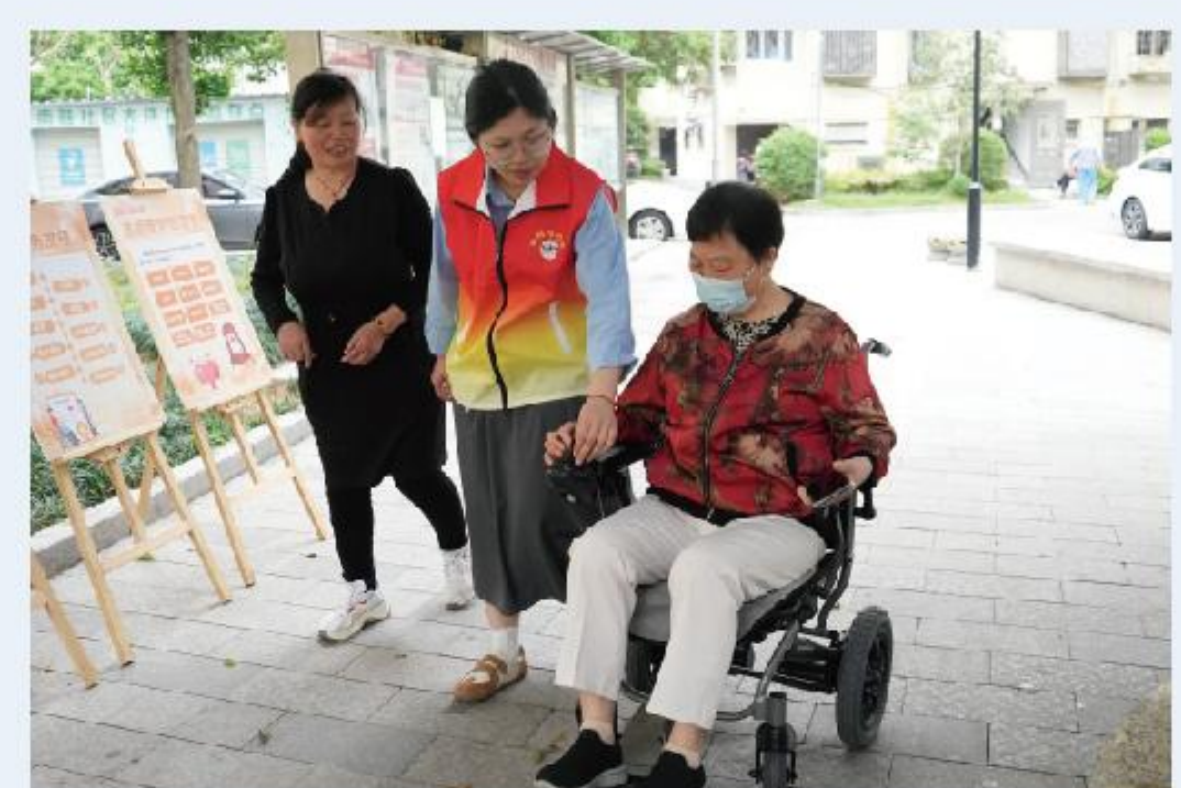
捐赠南雅社区电动轮椅和自动爬楼器