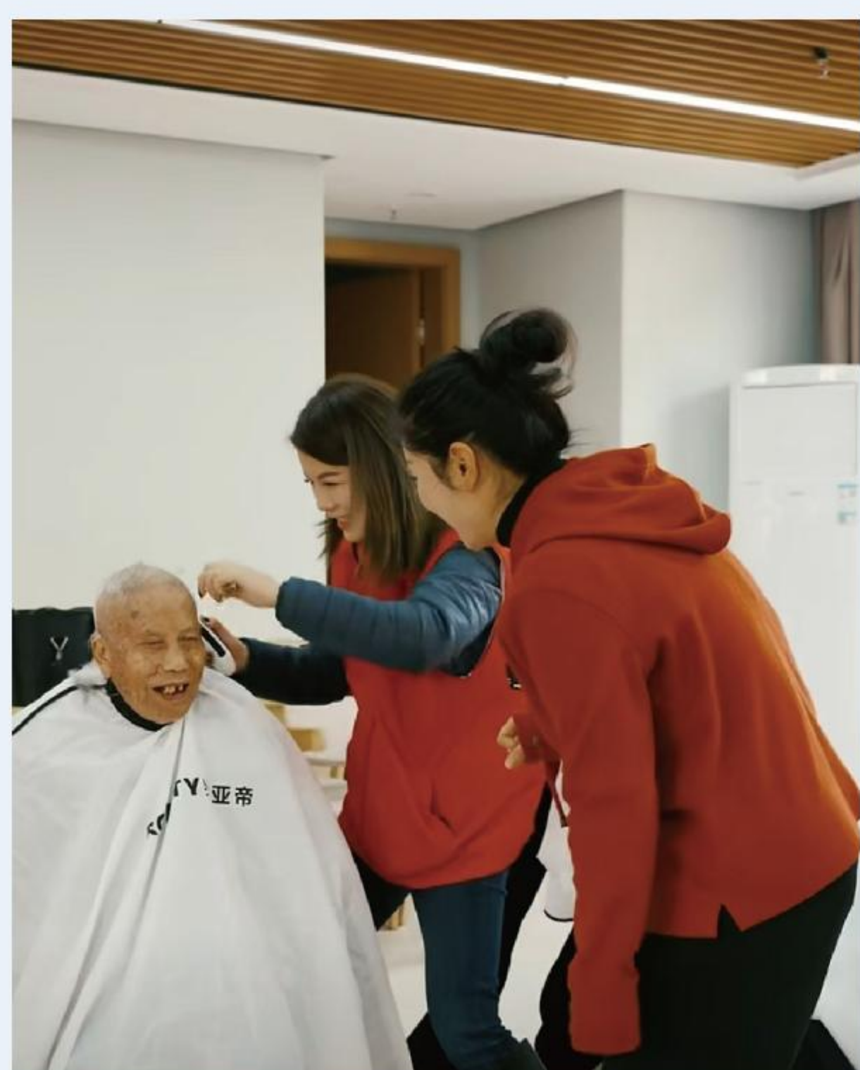
横街镇盛家村居家养老服务站

2025年度，基金会积极与各基层单位开展合作，分别在浙江省宁波市龙柏社区、南雅社区、南裕社区、潘火街道、钱湖丽园社区、泰安社区、月湖街道、海曙区横街镇盛家村、下应街道等9个单位落地项目，涵盖社区环境改善、便民服务、共富创业等多个领域，受益人数超 50,000人 ，有效推动了社区美好家园建设与居民和谐生活，初步实现了项目助力社区共建的初衷。