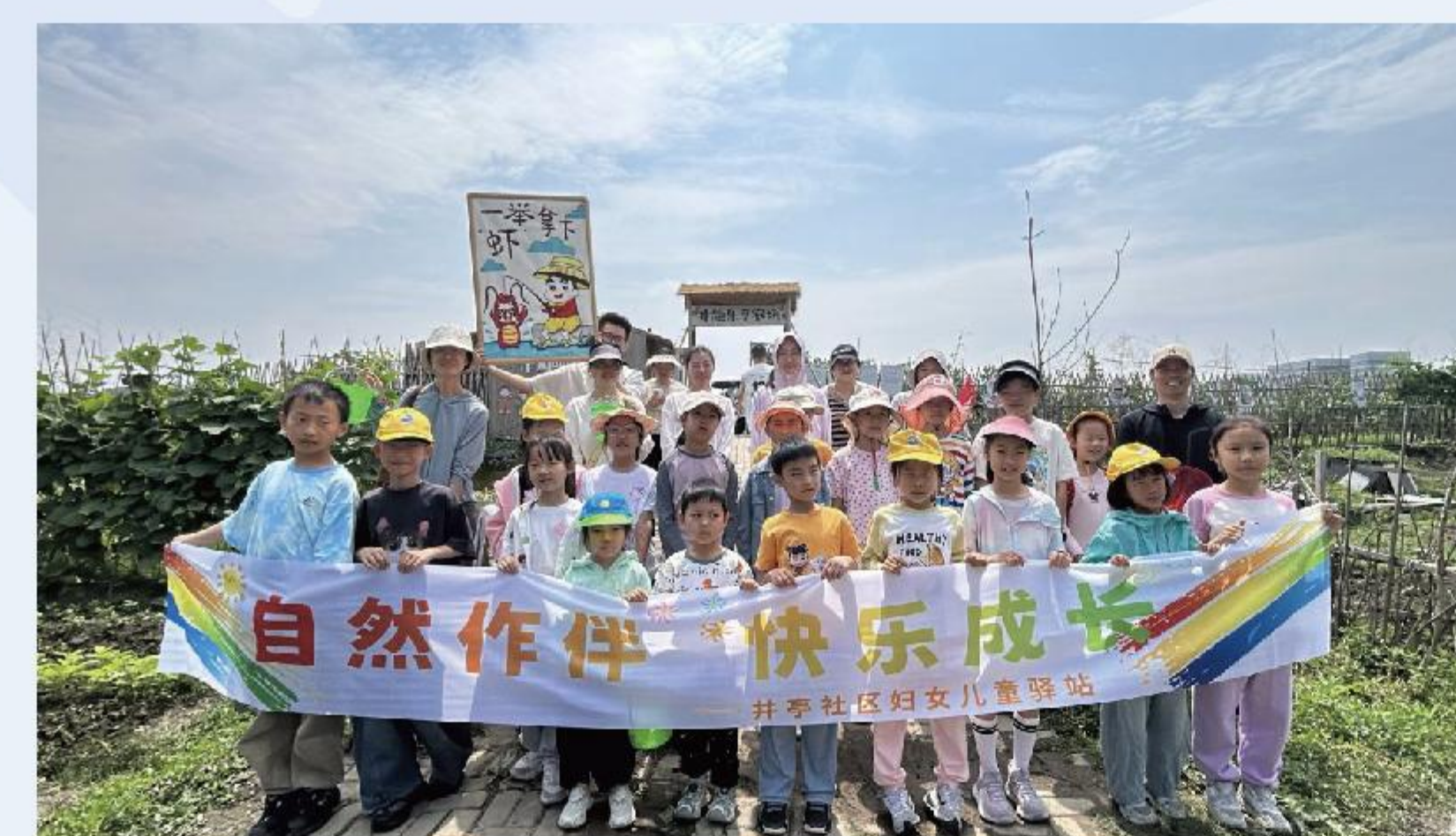
集士港镇井趣·乐享农场项目-亲子家庭土地认领计划

2025年度，项目支出 6.84万元 ，专项用于支持 8个优质公益项目 ，覆盖公益创业、残健共融、精神康复援助、社区共富、慈善医疗等多个民生领域。资助项目包括快乐代码小红花项目、云龙赛艇培训中心慈善创业共富基地项目、满天星残疾人服务中心葫芦工坊项目、“甬泉”慈善医疗服务项目等，各项目精准对接不同群体需求，兼具社会价值与落地性。