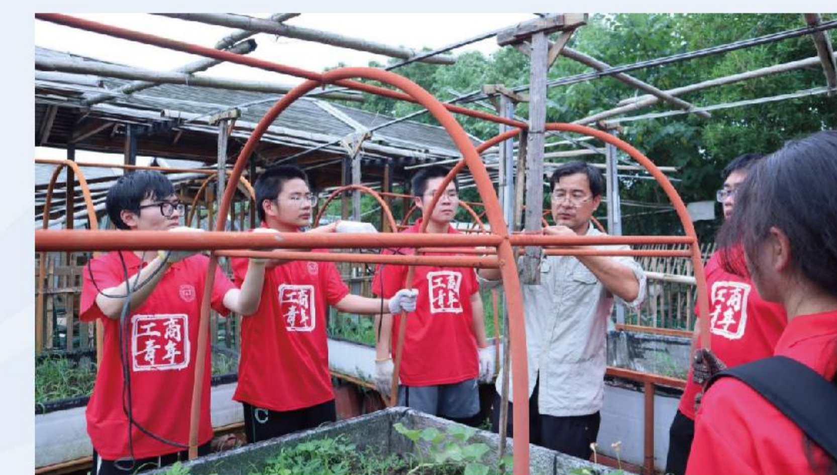
满天星残疾人服务中心残健共融一家人 星宝葫芦工坊