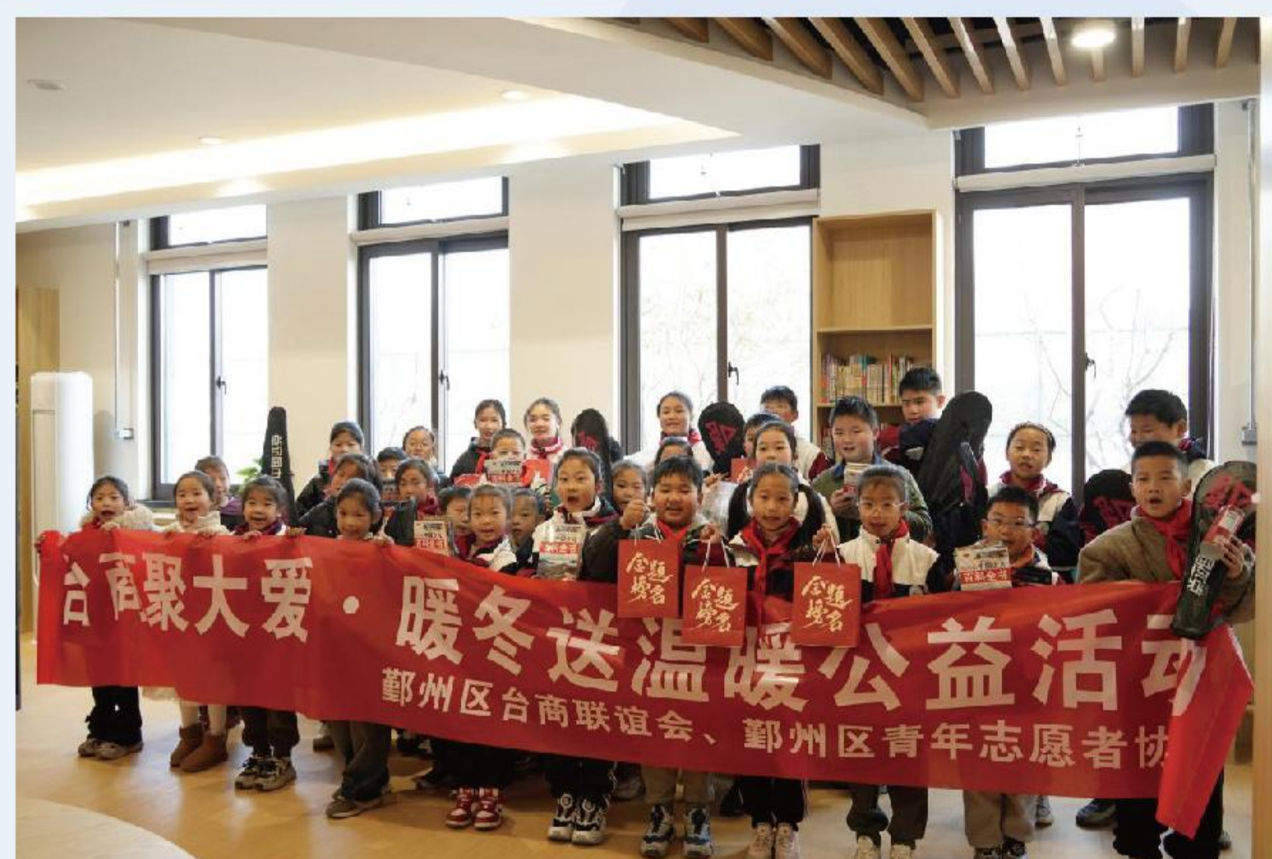
塘溪“暖冬微心愿”发放现场

2025年度, 项目开展个案援助8次, 支出10.6万元; 群体援助9次, 支出14.95万元; 累计援助17次, 覆盖困境儿童、自闭症患者、重病患者、困境老人、外来务工人员等群体, 实际受助人 数超1,700人 , 帮扶规模远超预期, 全年实际支出 25.6万元 , 资金使用规范、公开。