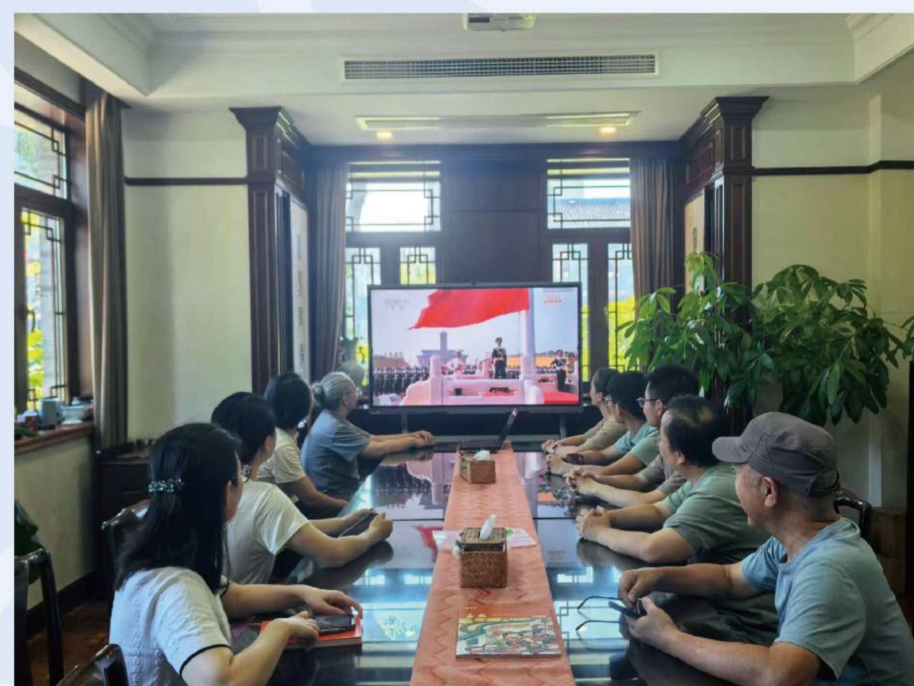
组织集中观看“九三”阅兵主题党日活动