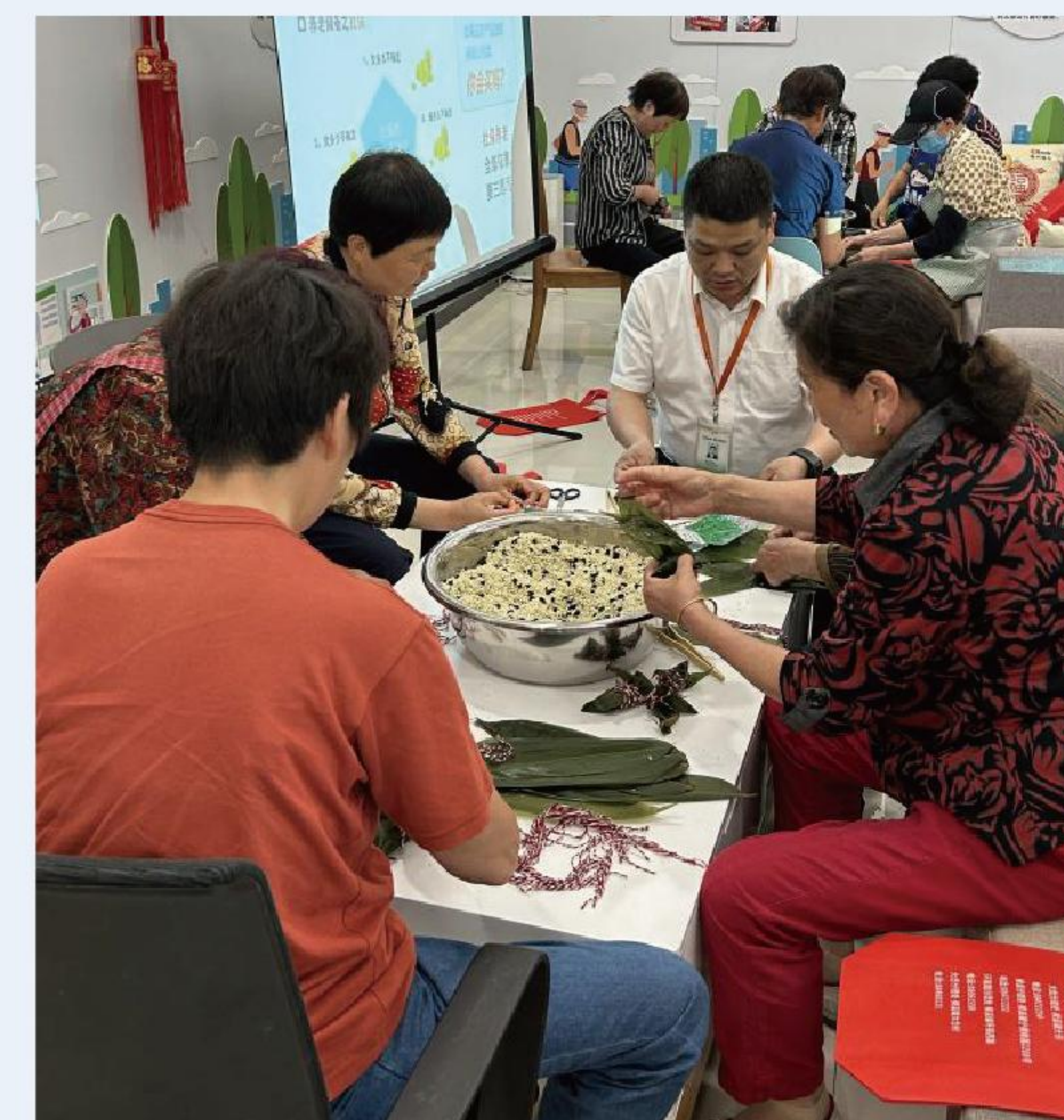
横溪镇端午节活动