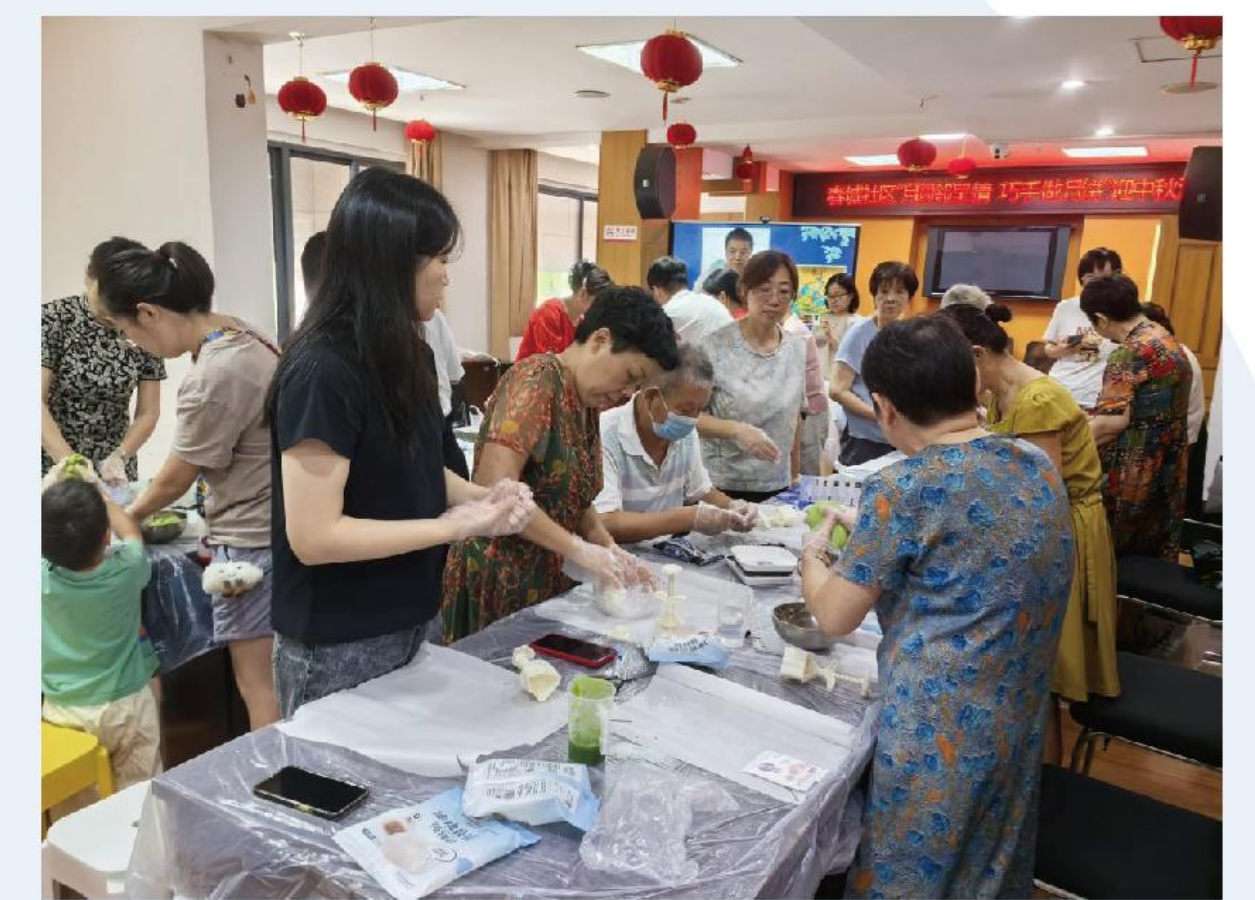
中河街道中秋节活动

通过节日文化与慈善公益的有机结合,项目既弘扬了传统美德,又搭建了社区公益参与平台,让慈善理念融入日常、深入人心,为社区公益文化建设与邻里和谐发展注入了温暖力量。