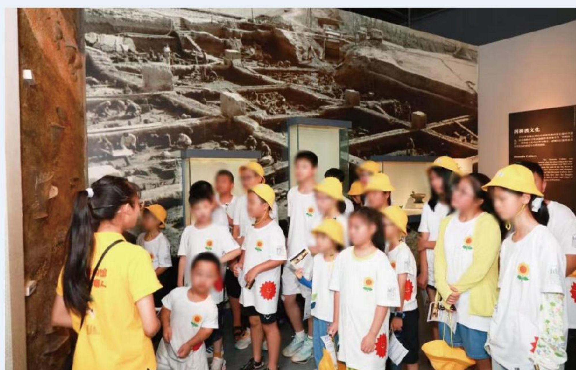
鄞领护苗向阳花开公益夏令营