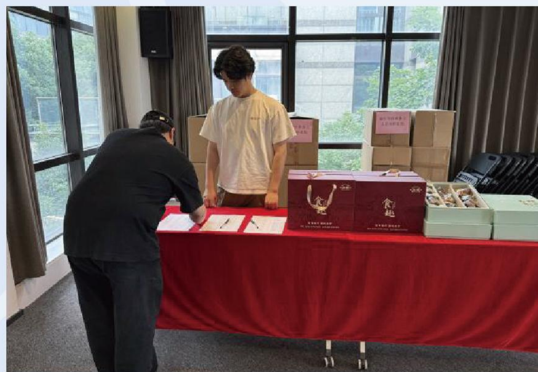
端午节为外来务工人员家庭发放关怀礼包