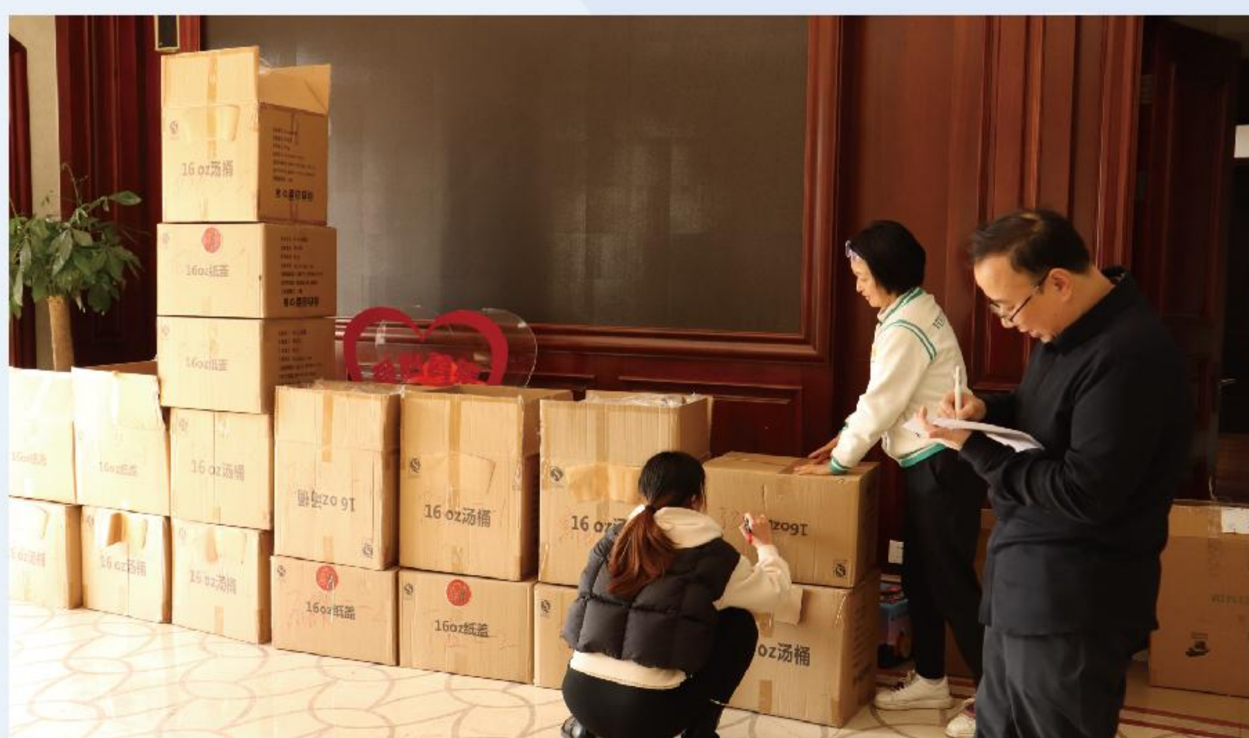
腊八活动物料分装

该项目不仅是公益关怀行动，更是城市文明与传统文化的生动传播载体，以小善行汇聚大温暖，持续传递社会正能量，助力构建和谐有爱的城市氛围。