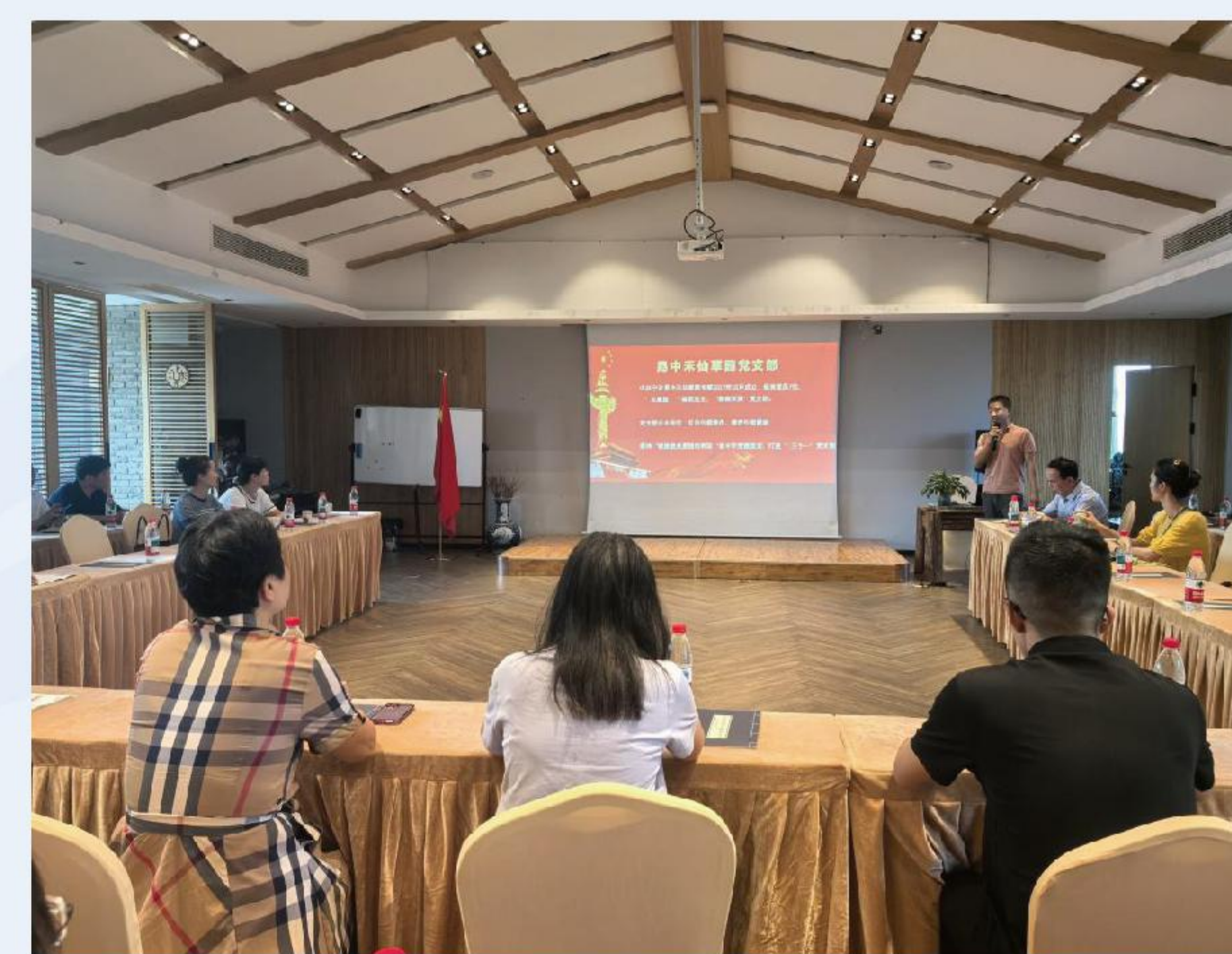
参加“鄞领双强”党组织书记交流活动