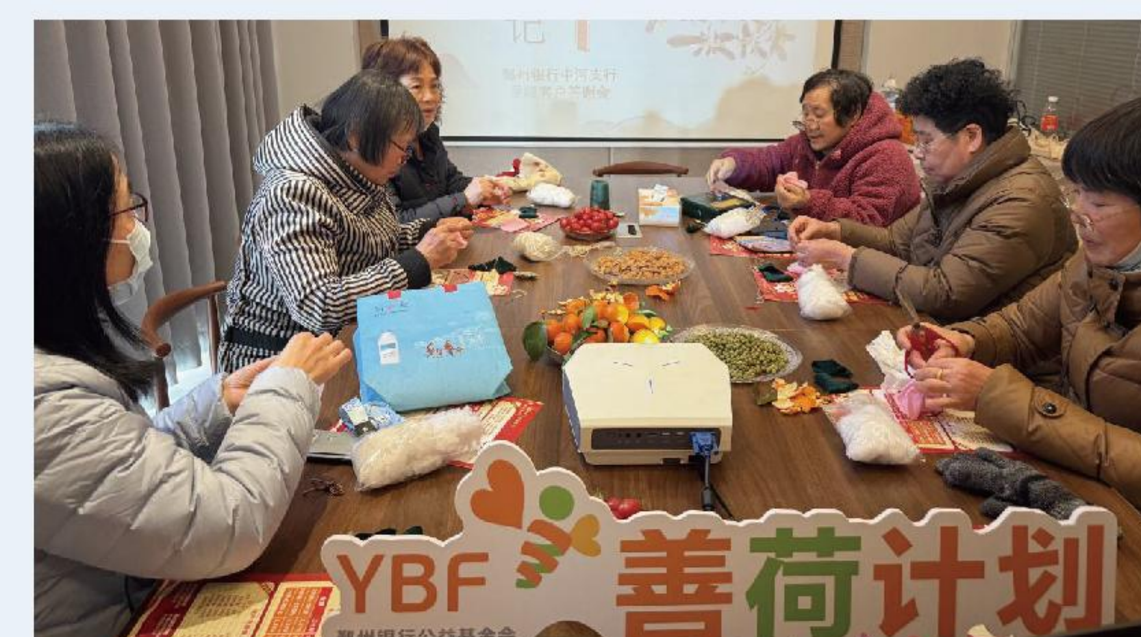
宁波市海曙区月湖街道梅园社区小香囊走出共富路