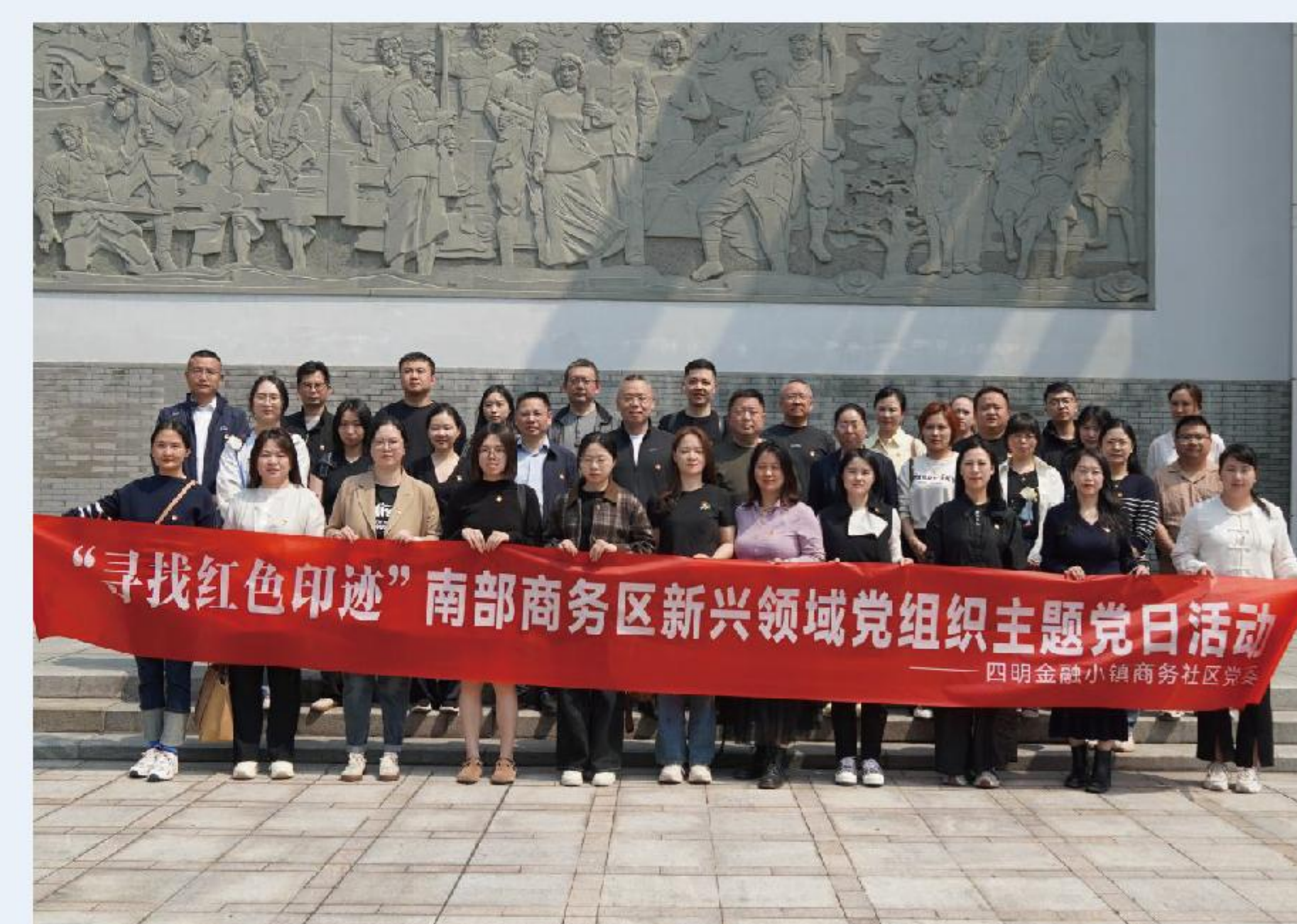
参加“寻找红色印迹”南部商务区新兴领域党组织主题党日活动