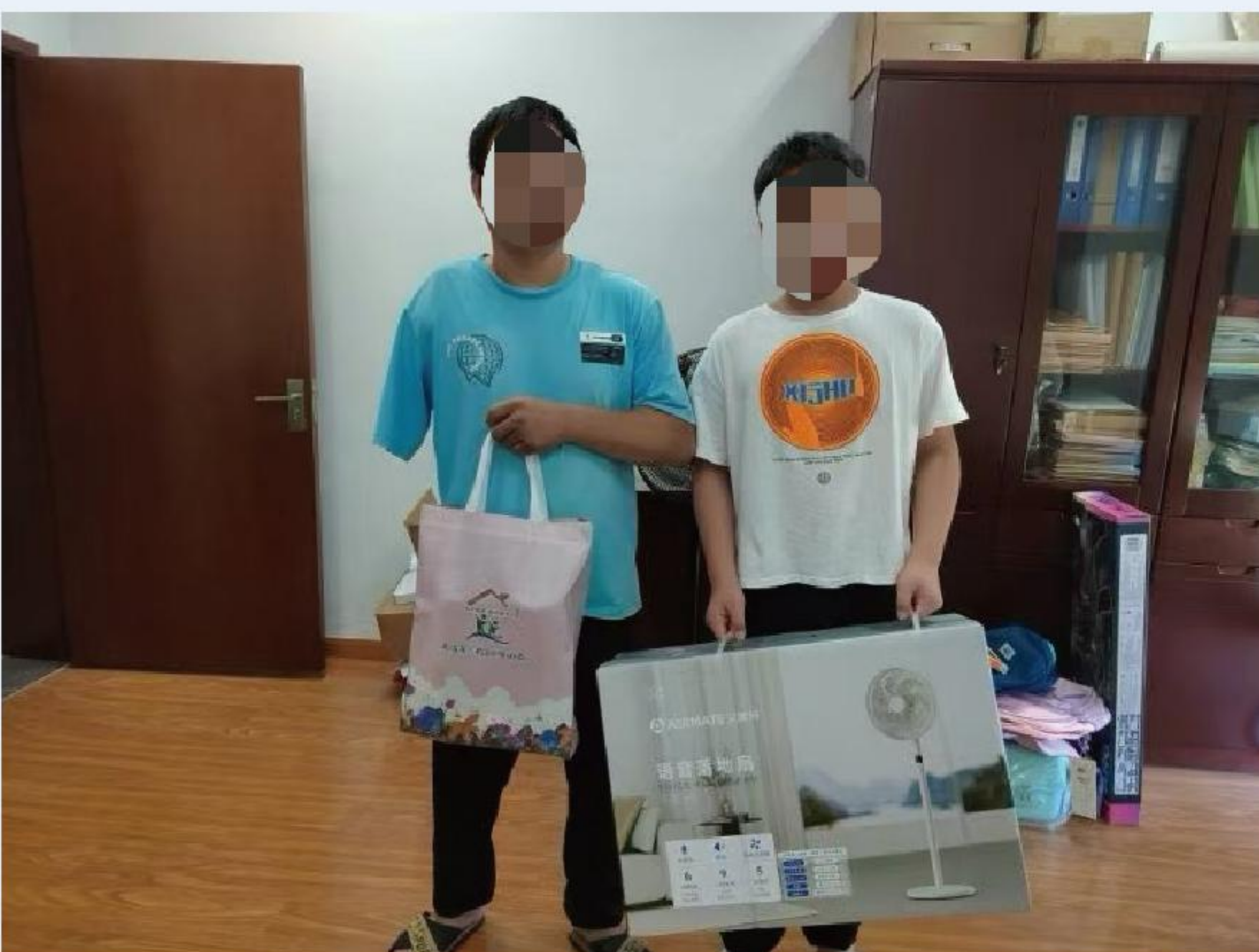
为鄞州区困境儿童发放微心愿