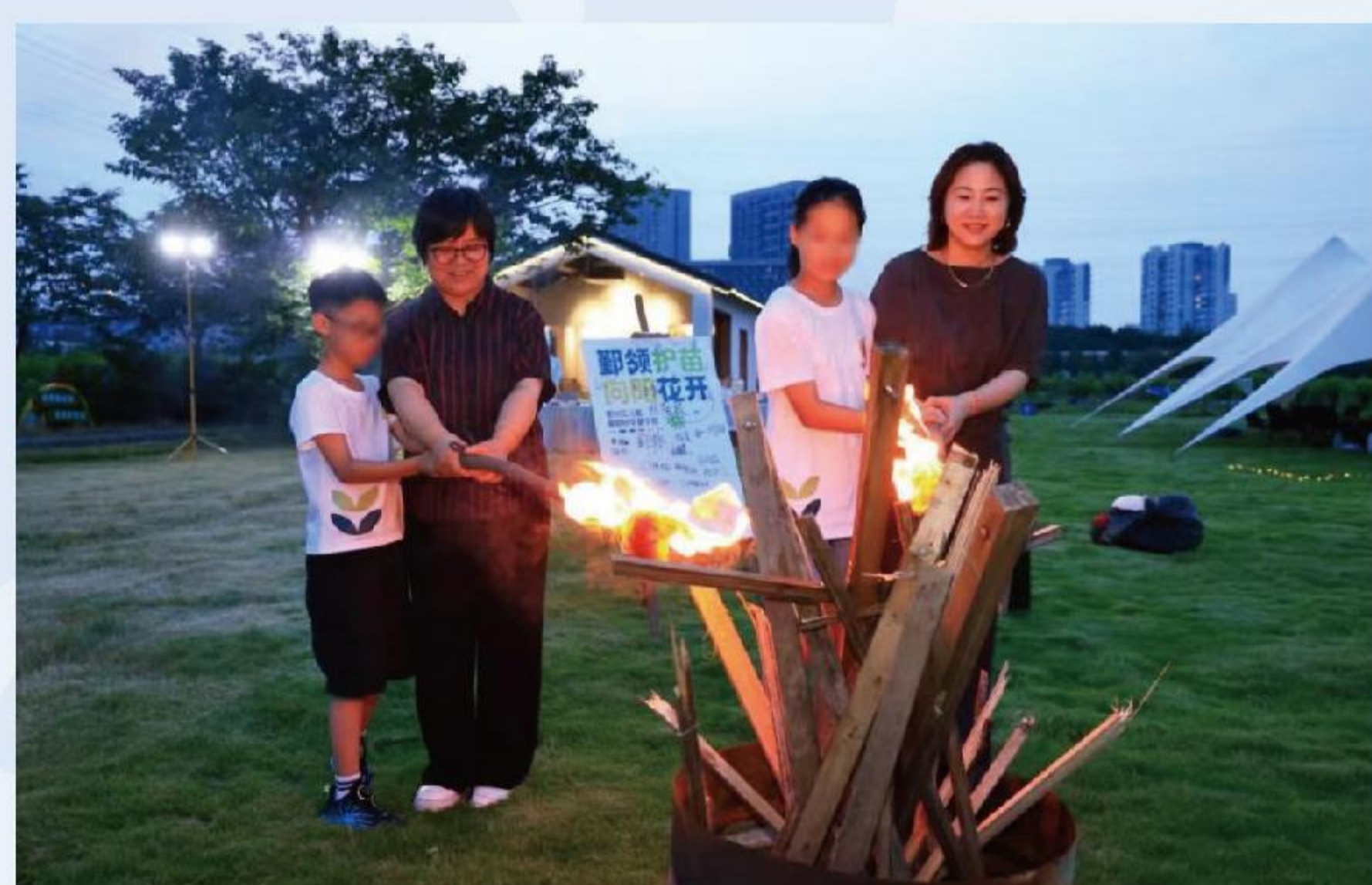
鄞领护苗向阳花开公益夏令营