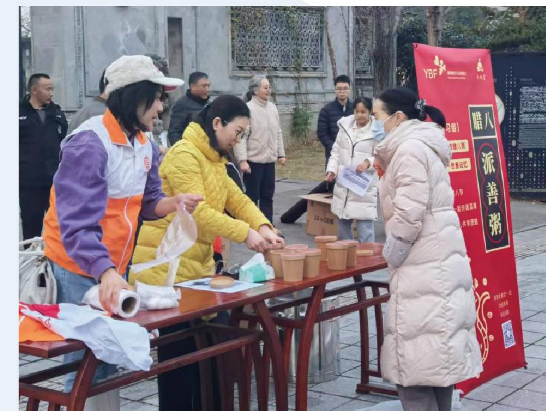
开展“腊八派善粥”志愿服务活动