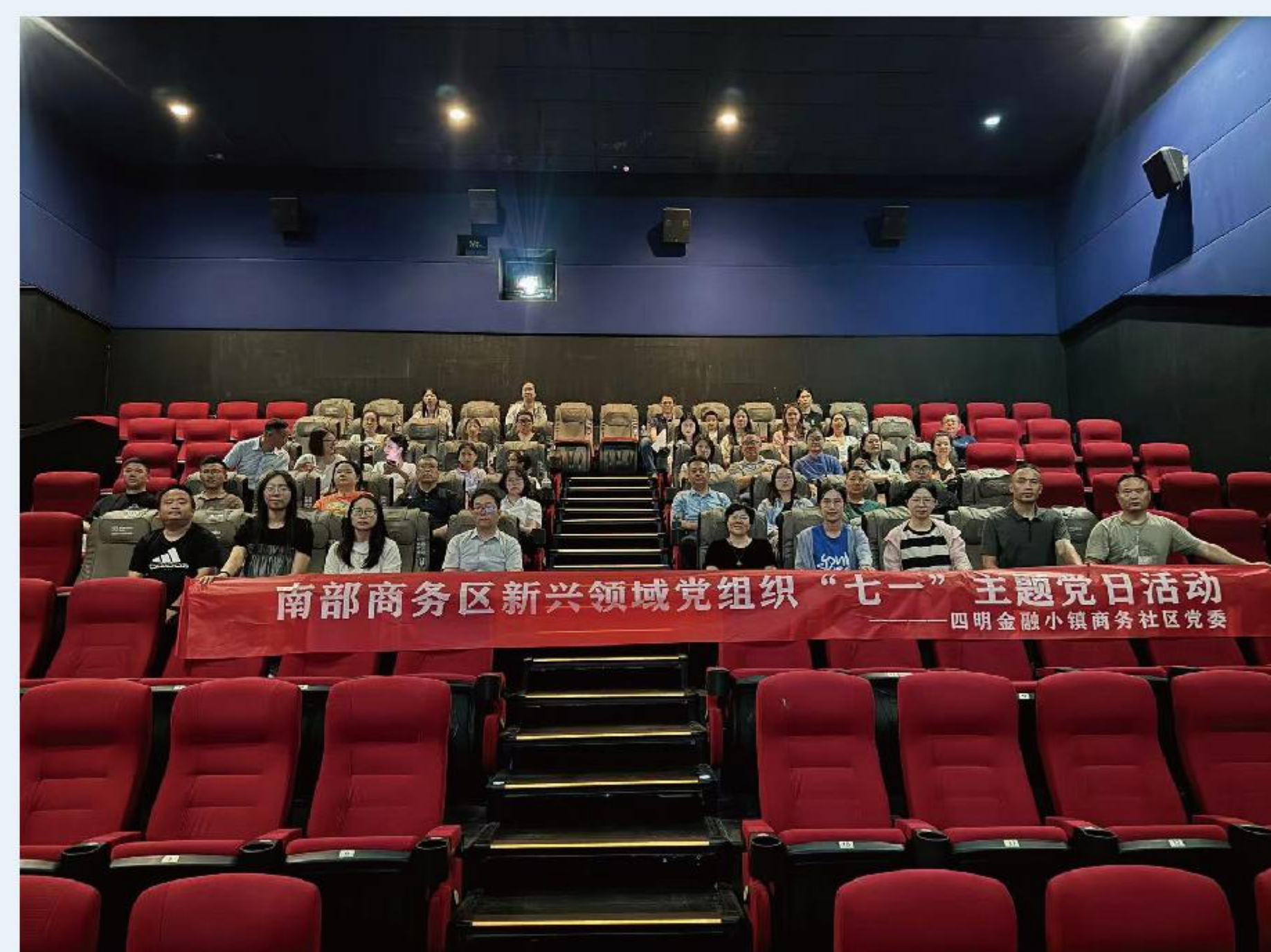
参加南部商务区新兴领域党组织“七一”主题党日活动