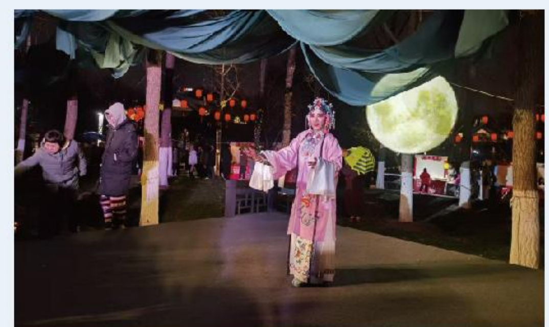
月湖社区开展元宵活动