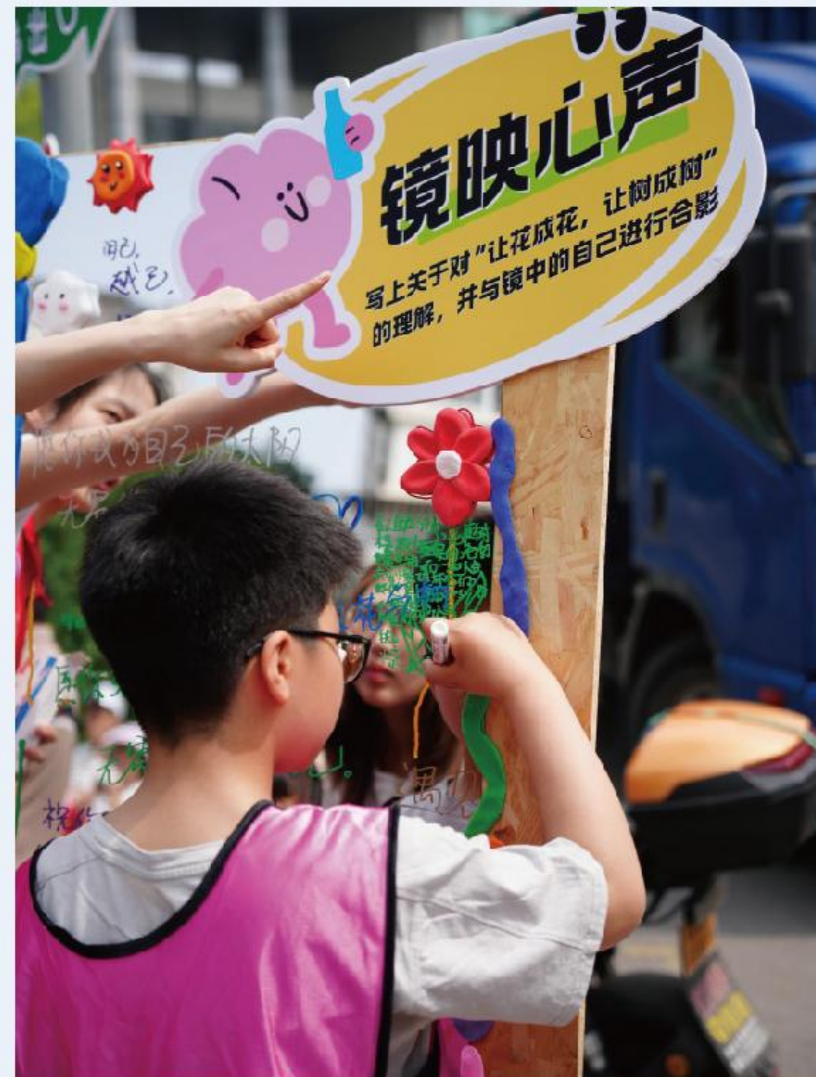
潘火社区自然疗愈花园