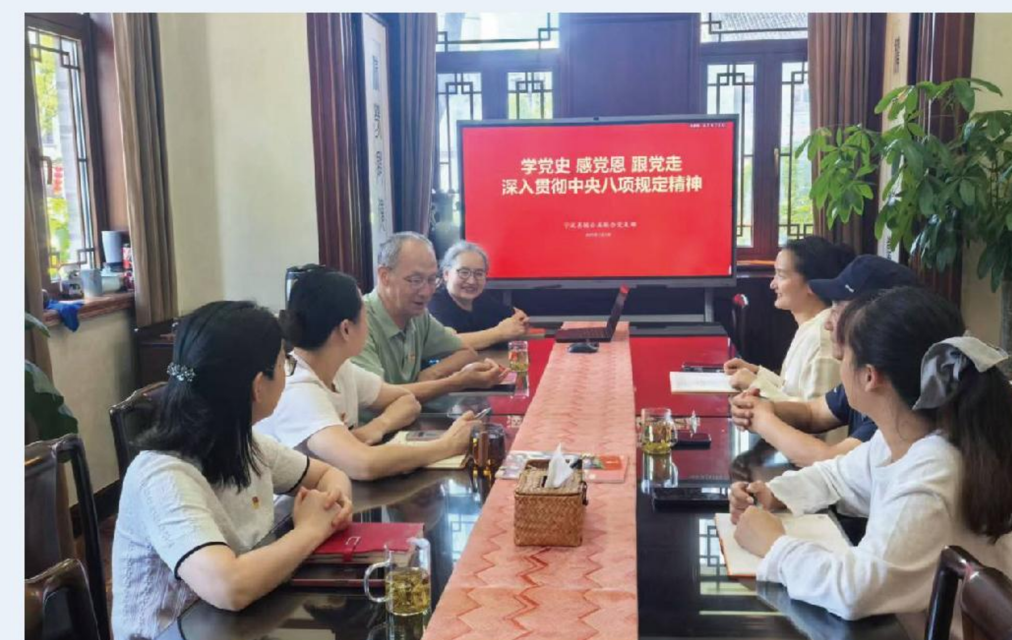
开展“学党史、感党恩、跟党走——践行中央八项规定精神”主题活动