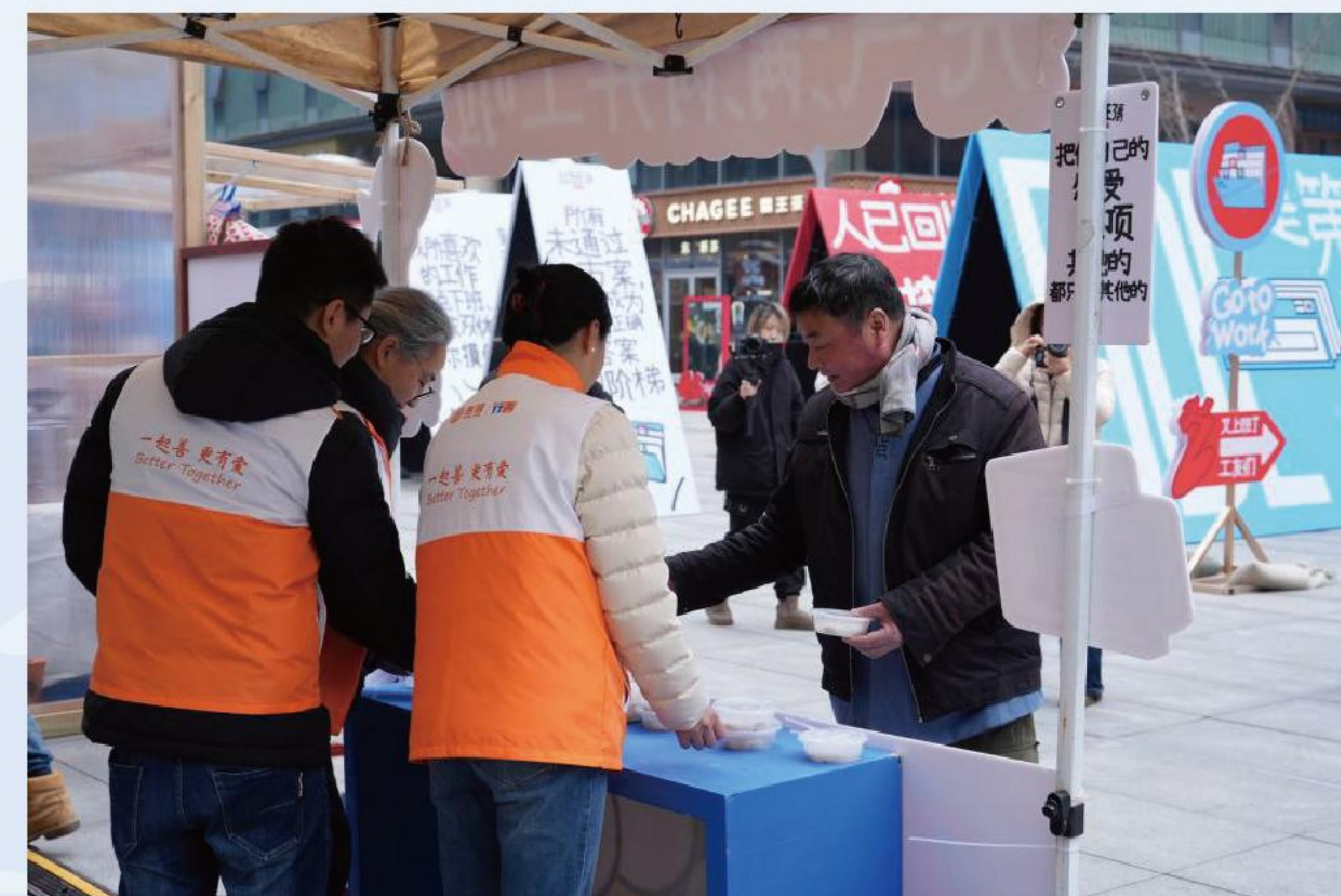
开展“元宵汤圆限时送”志愿服务活动

支部坚持推动党建工作向救急难、教育支持及区域援助等公益项目一线延伸,充分发挥慈善组织在社会治理中的积极作用,以高质量党建引领基金会公益事业不断前行。