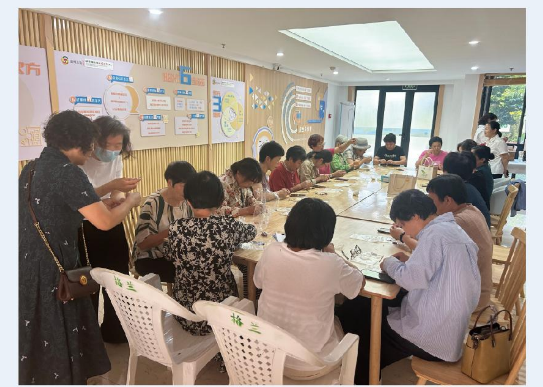
格兰春天社区端午活动