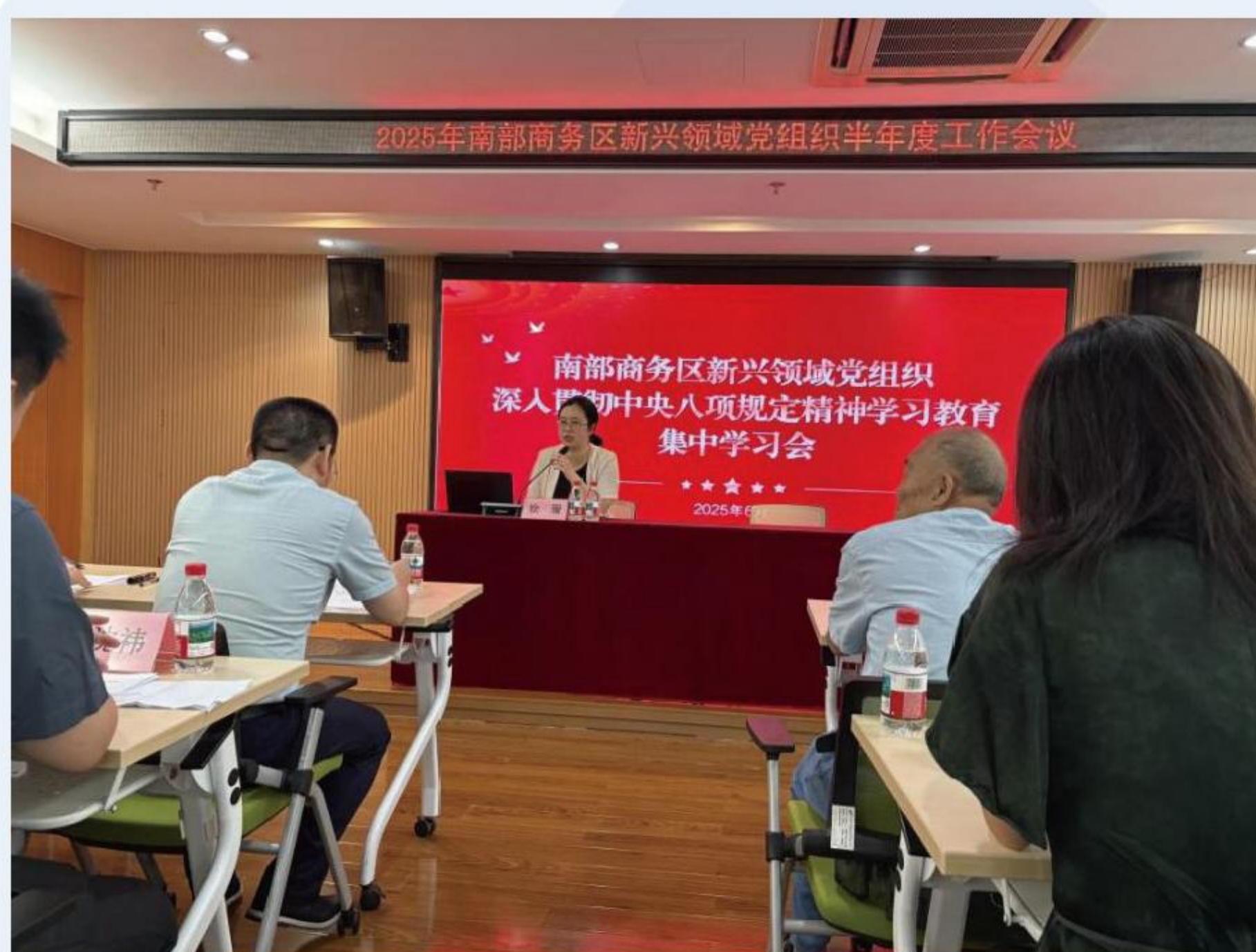
参加深入贯彻中央八项规定精神学习教育集中学习会