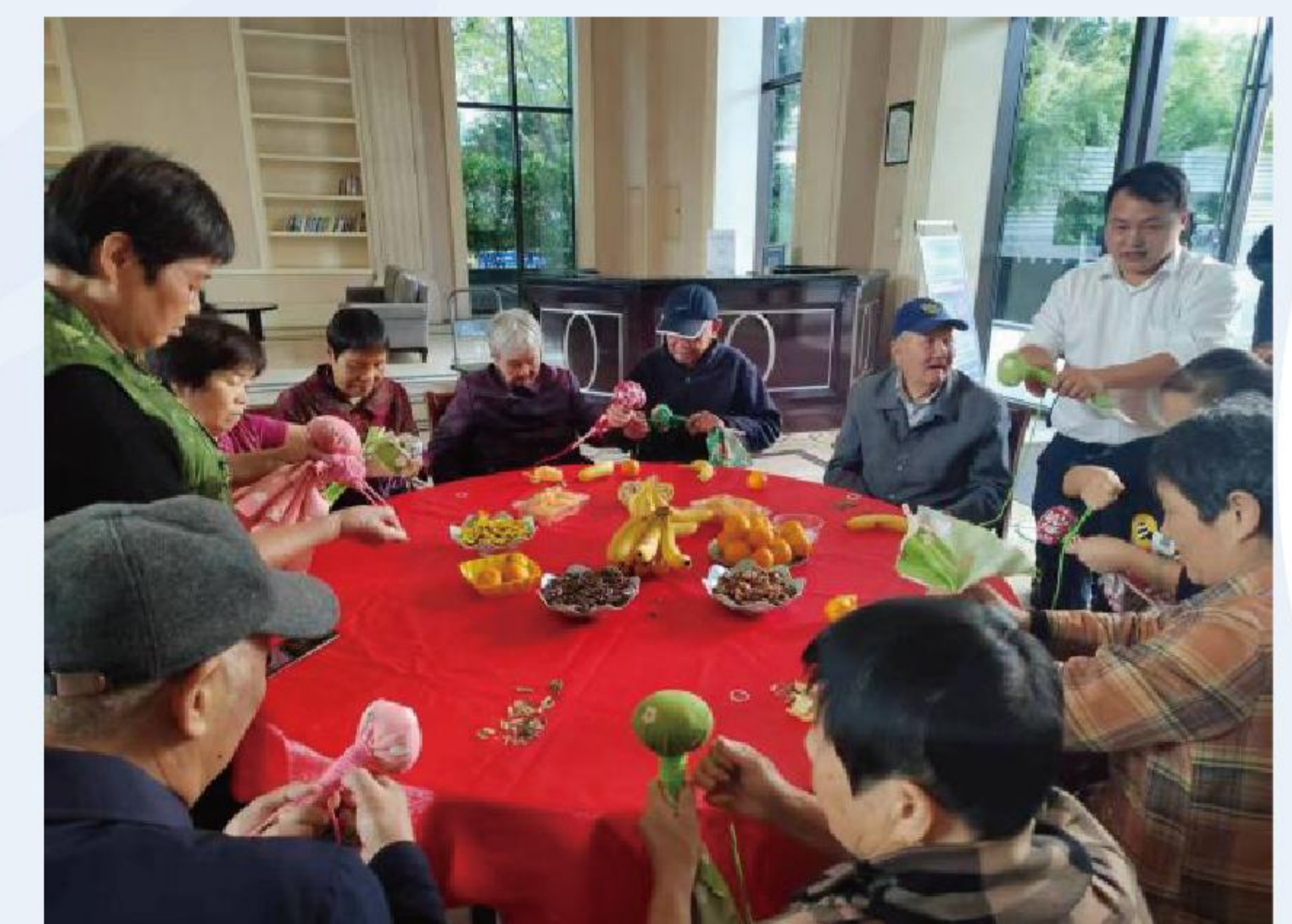
银桂社区重阳节活动