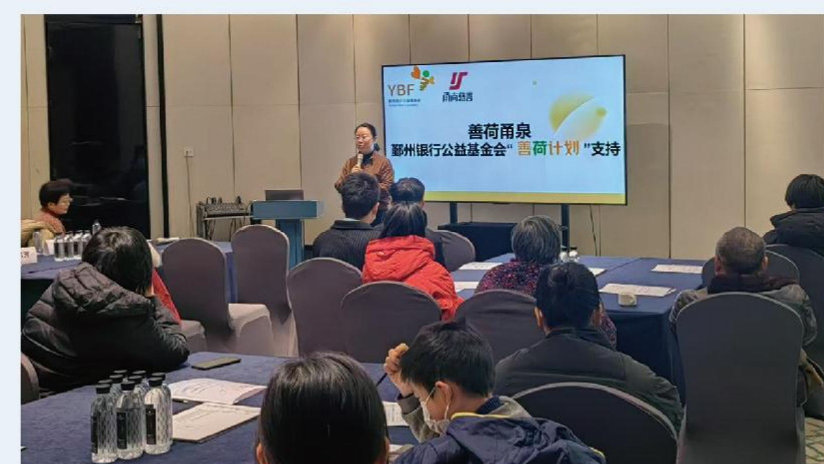
善荷甬泉——第一次血友病患者家庭小组支持会议