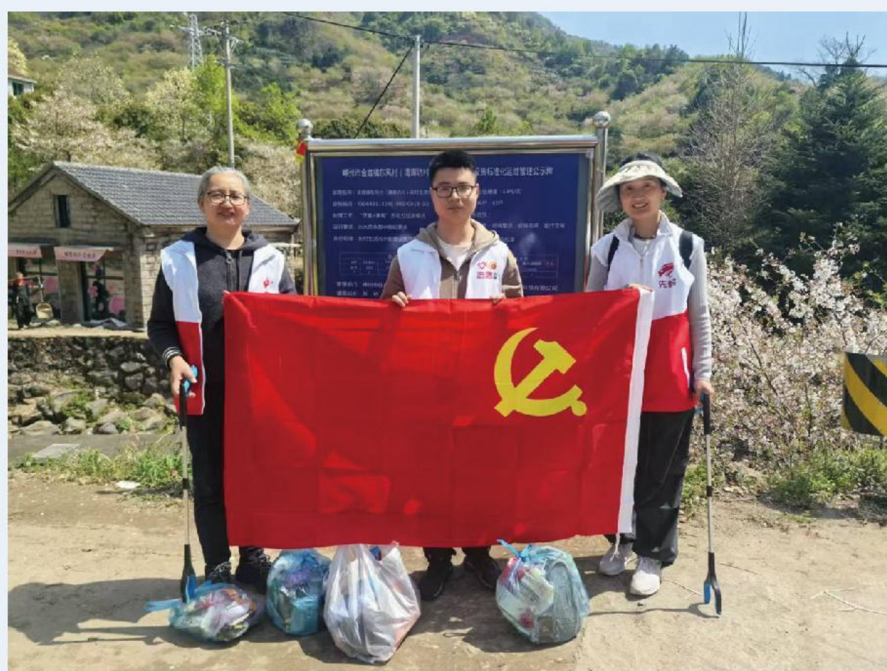
开展“边行走边公益”环保志愿活动