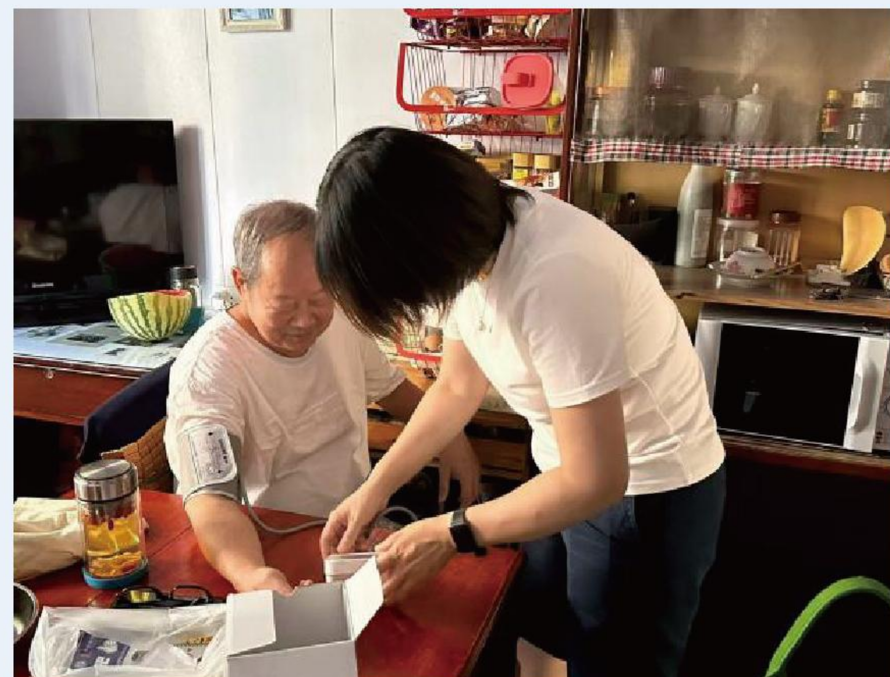
支持白鹤街道“康复温暖行”计划