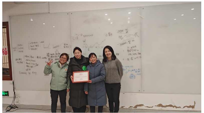
(2026年1月26-28日，第一期资助伙伴线下共学在河南郝堂村展开)