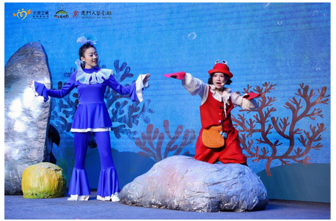
(2026年1月30日，演出首演照片)

详情点击： 演出回顾|累计吸引约550人次，天使之翼支持剧目《我们可以一起玩吗》温暖落幕！